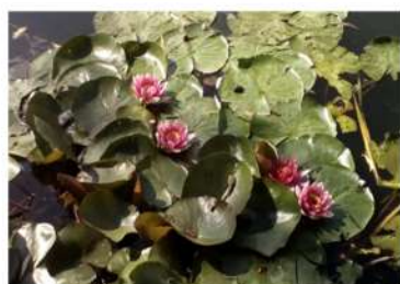
Верхній Горіхуватський ставок

Методи дослідження: описовий, дослідницький, метод синтезу теоретичних відомостей.